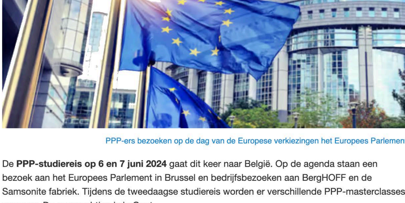
PPP-ers bezoeken op de dag van de Europese verkiezingen het Europees Parlement

De PPP-studiereis op 6 en 7 juni 2024 gaat dit keer naar België. Op de agenda staan een bezoek aan het Europees Parlement in Brussel en bedrijfsbezoeken aan BergHOFF en de Samsonite fabriek. Tijdens de tweedaagse studiereis worden er verschillende PPP-masterclasses gegeven. De overnachting is in Gent.